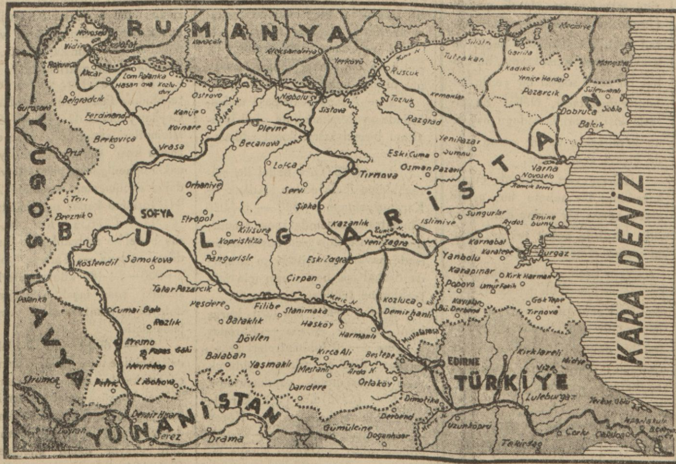
Bulgaristan ve Hudutları

Salı günü C. H. Parti grubu toplanacak, bu içtima da hükümet dünya vaziyetinin arzlediği manzara etrafında izahat verecektir.